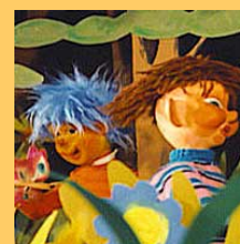
El clavel desobediente

"Como todas las cosas que emprendo, primero lo hago con mucho amor hacia los niños; siempre busco que los entretenga, los divierta..."