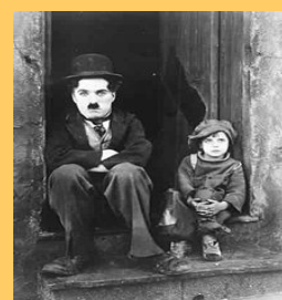
Chaplin con Jackie Coogan en El chico