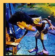
El jefe y el carpintero

"Como todas las cosas que emprendo, primero lo hago con mucho amor hacia los niños; siempre busco que los entretenga, los divierta..."