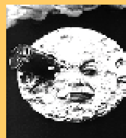
"Viaje a la Luna" (1902)

Los actores y actrices se convirtieron en verdaderos mitos; Gloria Swanson, Rodolfo Valentino, Chaplin, Keaton y muchas otras figuras famosas comenzaron a formar parte del star system hollywoodiense. De ahí que pueda afirmarse que este ha sido el debut del cine como un poderoso medio de comunicación de masas.