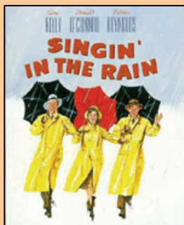
Cantando bajo la lluvia. (Singin' in the Rain),