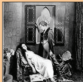
Don Juan , dirigida por Alan Crosland y protagonizada por John

Con la llegada del sonoro también cambió el montaje de las películas y se formaron multitud de profesionales al amparo del mismo. De la misma manera que cambiaron los guiones, al añadirse la música y los sonidos el montaje se hizo mucho más complejo. Antes había un trozo de película, la imagen. Ahora eran necesarios dos trozos de película (la imagen y los diálogos). Se añadieron enseguida más bandas, las correspondientes a las músicas y a los efectos sonoros. Todo se hizo posible gracias a la moviola, la máquina de montaje, que aunque existía antes, «la moviola muda», sin ella hubiera sido imposible montar las películas musicales que tanto influyeron en los primeros momentos del sonoro.